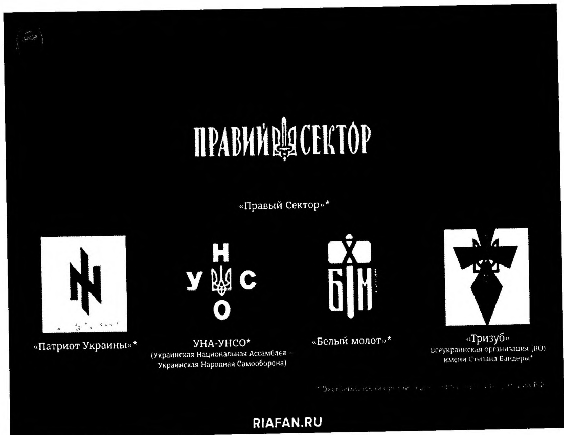
Рис.1 «Тату-эскизы» неонацистов в РФ.