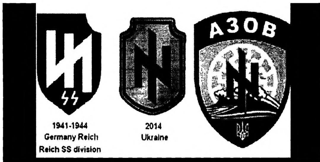
Рис. 2 Атрибутика украинских неонацистов и ее сходство с атрибутикой немецких нацистов прошлого века.